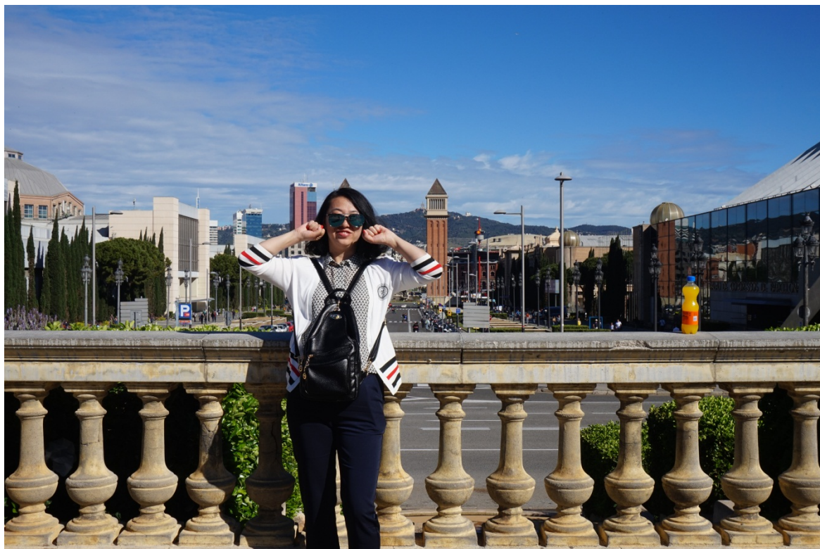
图 15 加泰罗尼亚国家艺术中心。