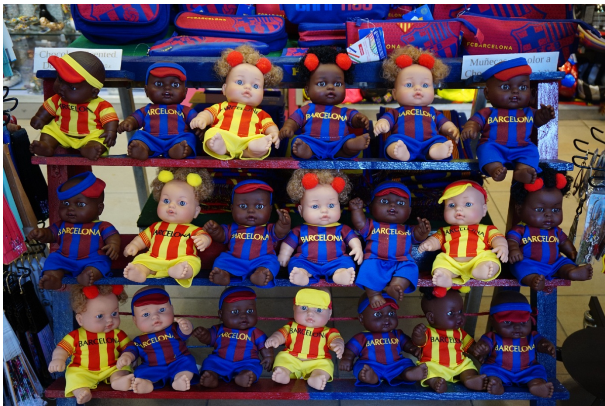
图 5 兰布拉大道上的纪念品。