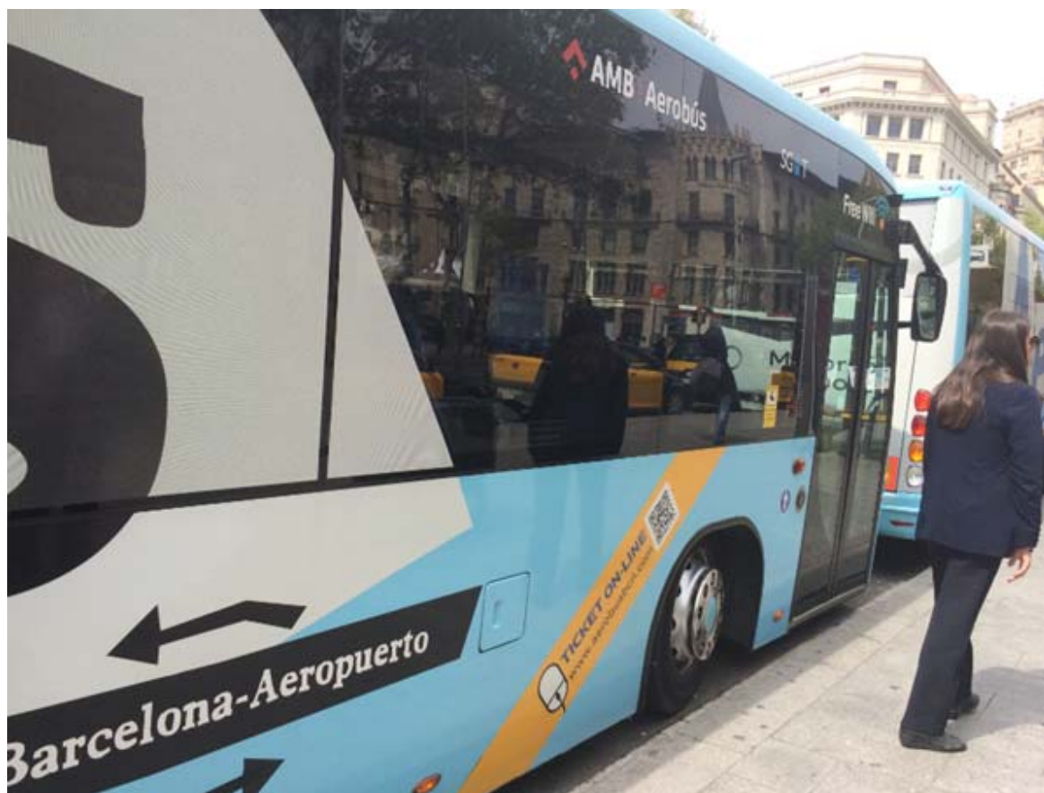
图 2 机场巴士。