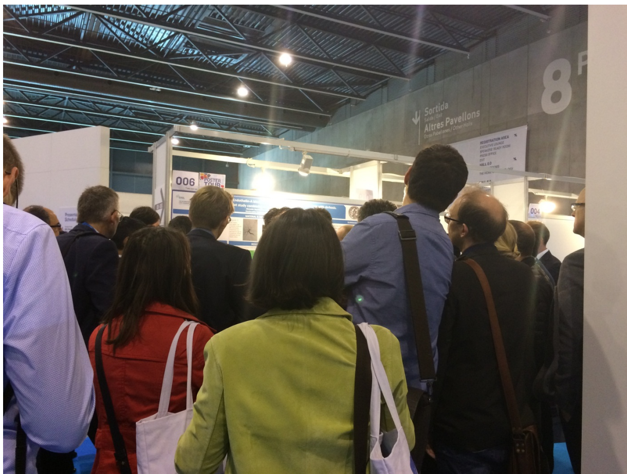
图 11 壁报展示。