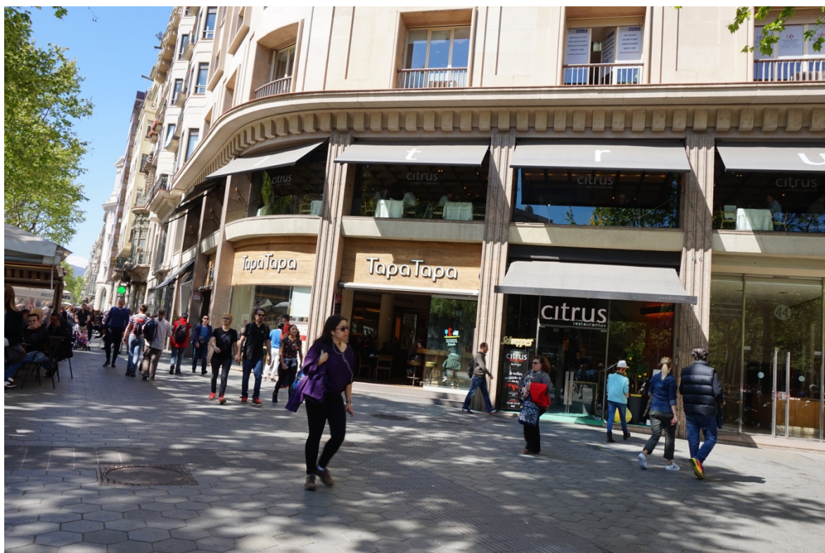
图 3 Tapa Tapa 餐馆。