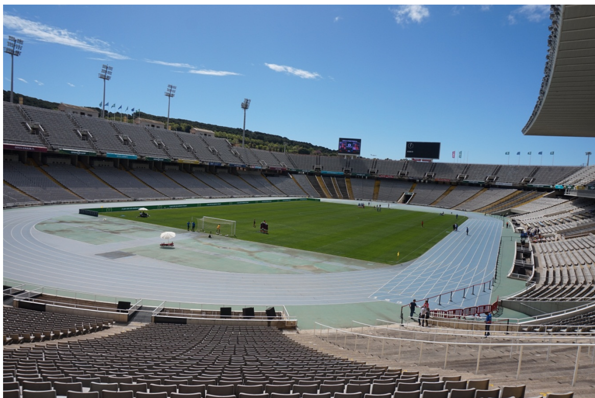
图 16 巴塞罗那奥林匹克公园。