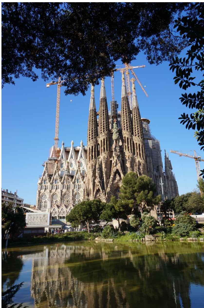
图 13 圣家族大教堂。

参观完圣家堂，时间已经是下午一点了，感觉饥肠辘辘，攻略里提到一家中国人开的海鲜餐厅很不错，叫 Wok Dao（图 14），Wok 在西班牙语里是铁板烧的意思，这家餐厅是自助式的，只有交 14.5€ 就行了，不过不包括酒水，我点了一杯可乐，好贵啊，要 2.5€，我在这里尽情享受了海鲜大餐，真的很好吃，尤其是铁板烧芦笋。