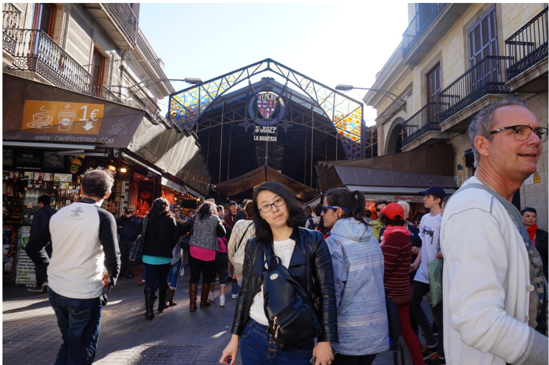
图7 波盖利亚市场。其次，请 WJG 编辑部各位员工，猜四个字的谜语。谜语为我为何将背包跨在前面，而不是其他位置？您知道？猜中者有礼品。

深的就是进门处水果摊主摆放的水果，新鲜而饱满，泛着令人愉悦的光泽，拥有艳丽夺目的色彩。在水果摊上买了杯很受欢迎的饮料，奇怪的味道。