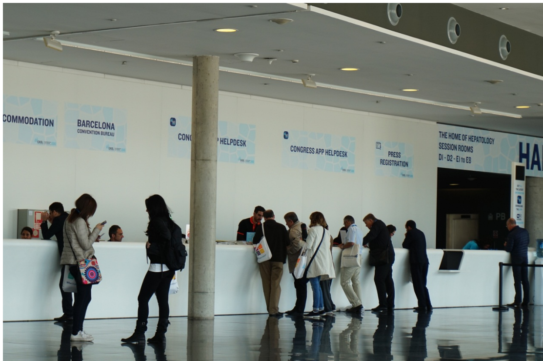
图 6 EASL 会议注册报到。