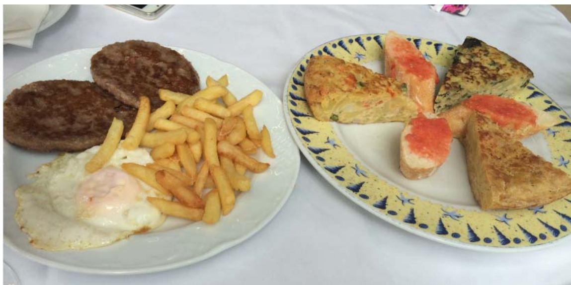
图 17 Les Quinze Nits 饭店。