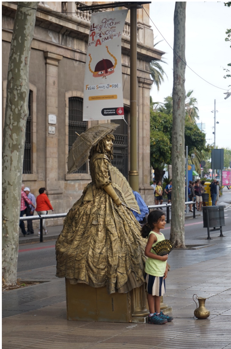
图 8 街头表演。

五花八门的“真人雕塑”沿街林立（图 8），吸引着各地的游客在这里云集，游客们和街头艺人一起拍照，画面真实而生动。