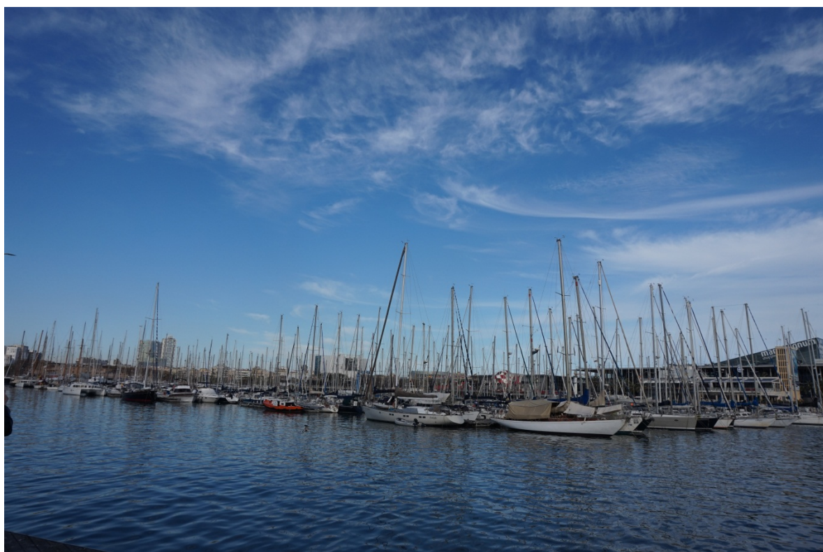
图 10 哥伦布港。

过了纪念塔就是哥伦布港，那里挺满了游艇。我怀疑全欧洲富人的游艇都聚集在这里了（图 10）。