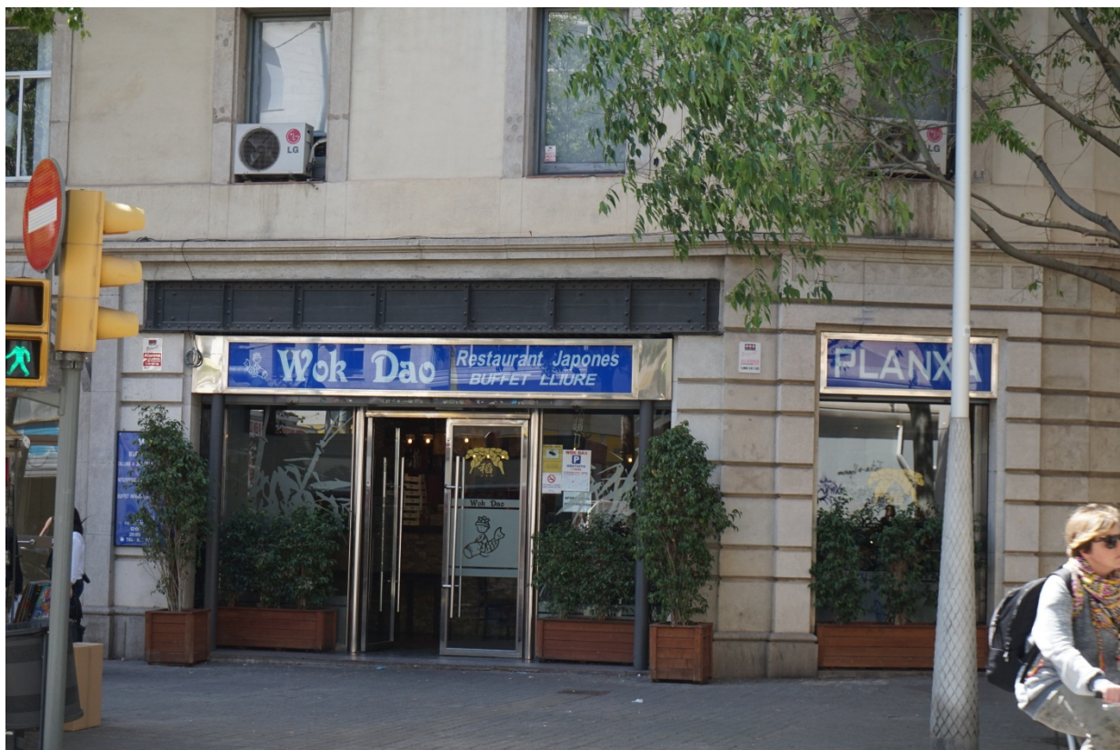
图 14 Wok Dao 餐厅。

吃饱喝足了，时间还早，我准备去一下奥林匹克公园，乘坐地铁在西班牙广场站下车，往北看，就能看到一个恢弘的建筑---加泰罗尼亚国家艺术中心（图 15），拾级而上，在加泰罗尼亚国家艺术中心的门前可以俯瞰整个城市，绕道艺术中心的后面，就是蒙锥克山，奥林匹克公园就在这上面，这个奥林匹克公园（图 16）是为 1992 年巴塞罗那奥运会而建的，远远的就能看到高高耸立的电视信号发射塔，这里是整个巴塞罗那的最高处，再往里走就是奥运场馆了，场馆不算大（不能和鸟巢比），游客也不算多。