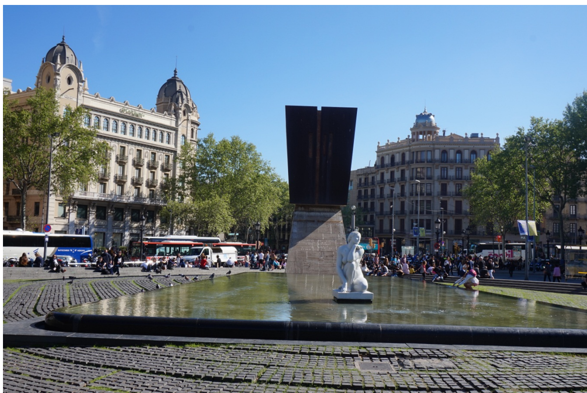
图 4 加泰罗尼亚广场。