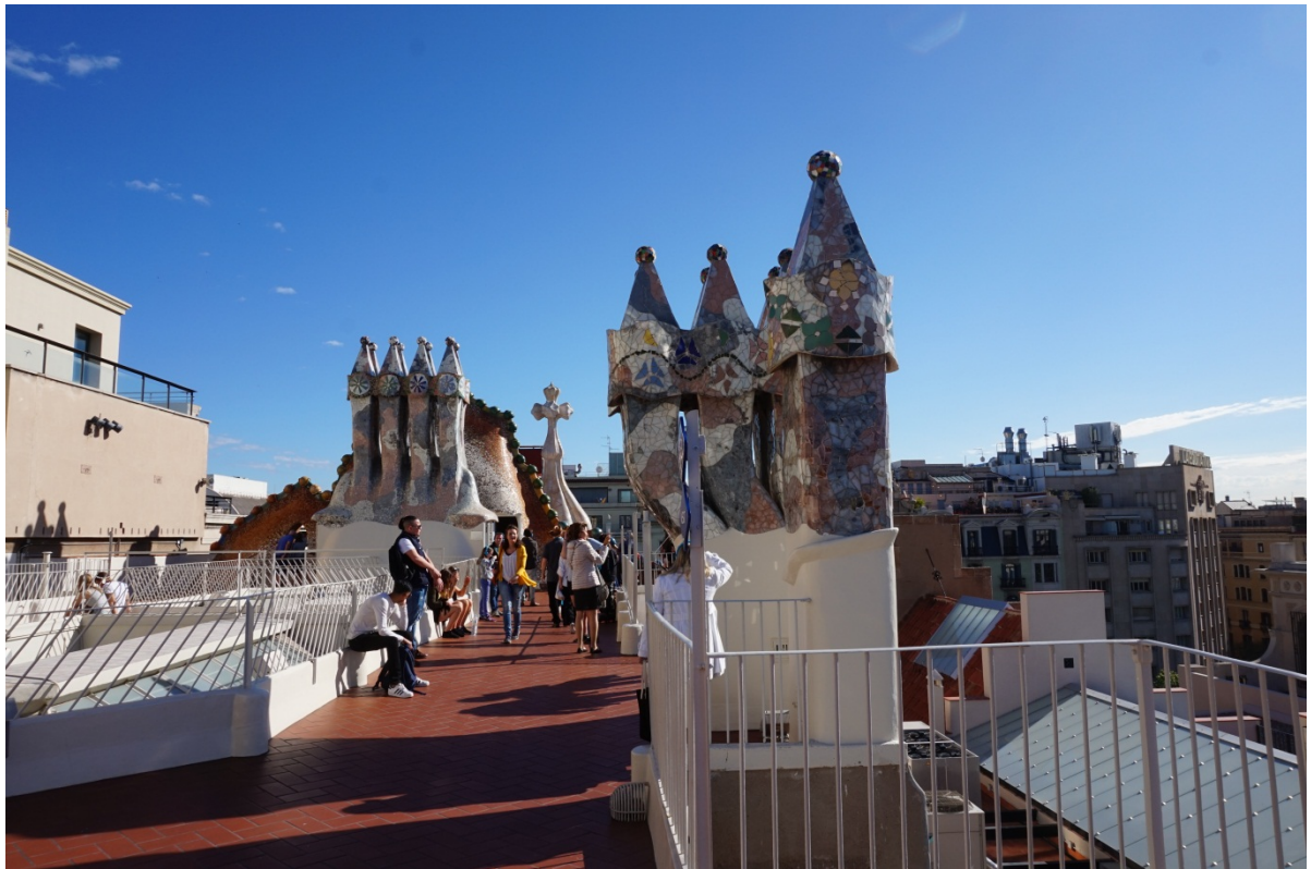
图 12 巴特略之家。

在巴塞罗那留下了 20 多件作品，其中有 7 件被列为世界遗产。而巴特略之家就是高迪的代表作之一，巴特略之家（Casa Batlló）是建筑师安东尼·高迪同若热普·玛丽亚·茹若尔（Josep Maria Jujol）合作装修改造的一座建筑。在外面看巴特略之家的二楼就像巨龙的嘴（图 12），而房顶就像巨龙的脊背，这幢房子充满了魔幻主义色彩，整幢房子就是一个童话世界。来到里面，精美奢华的装修可以看出房屋主人的财力及高迪的建筑天分，精美绝伦的天井及色彩斑斓的玻璃构成了一个不真实的世界。