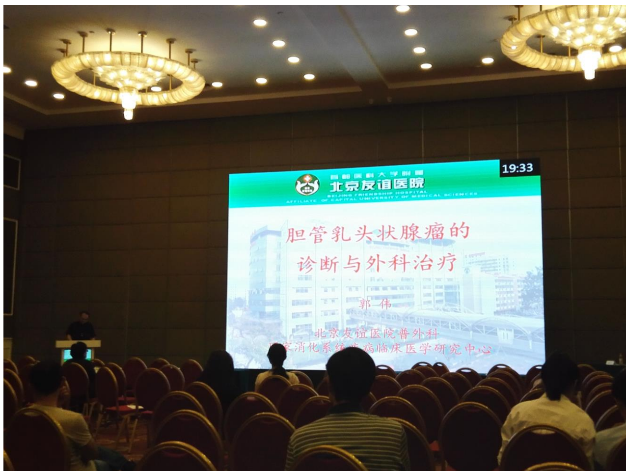
图 12 胆管乳头状腺瘤的诊断与外科治疗(郭伟).