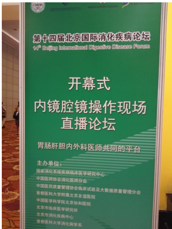
图 2 第十四届北京国际消化疾病论坛指示牌.

通过阅读会议日程册，了解到此次会议分为胃肠肝胆内外科联和论坛、临床研究及大数据质量管理分会场、遗传代谢分会场、麻醉分会场、护理分会场、胃肠道影像诊断分会场、消化系早癌分会场和著名国际会议快讯等多个专题研讨会。半个小时的开幕式后，多功能大厅和三个会议室齐头并进，同时展开各个专题的讲座。我决定有选择性的来聆听各大专题讲座。首先在多功能大厅观看了操作专家内镜诊治的演示(图 3)，娴熟的操作技术，严谨、不急不躁的操作方式以及内镜诊断与操作的一气呵成，让参会的学者们叹为观止，会场主持人不时对操作技巧、注意事项、操作要领进行精彩点评。