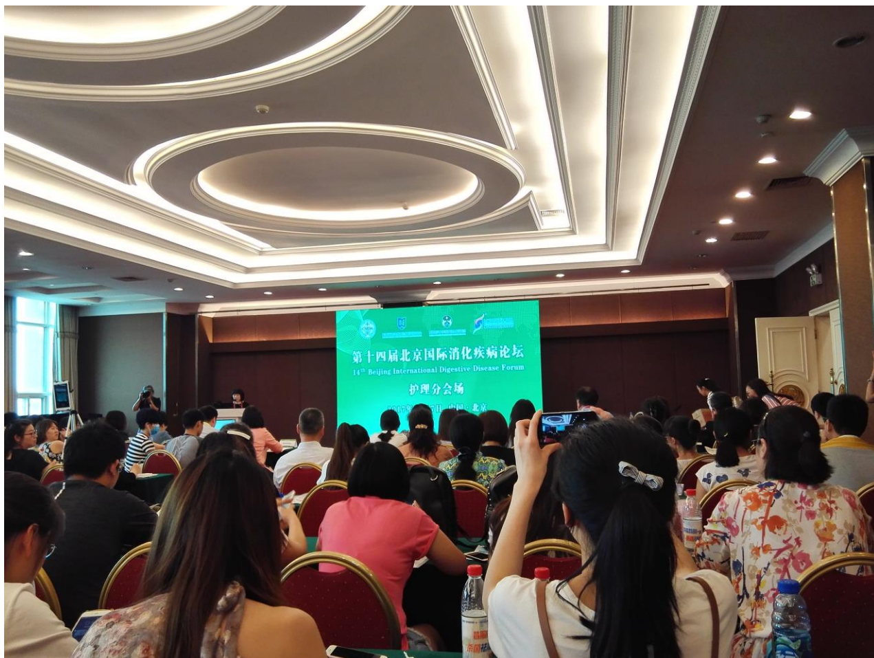
图 7 护理分会场.

茶歇期间，进入医药企业展厅，有两个小展厅供参展商推广自己的产品。我带着一本《世界华人消化杂志》同十余家企业进行了沟通，介绍了杂志，表达了是否有向杂志投放广告的需求，但参展工作人员均表示如果有需求会主动联系。因此我给参展商留下了名片。期间发现，某企业在宣传自己药物的时候，使用 World Journal of Gastroenterology 的两篇相关性稿件进行推广(图 8).