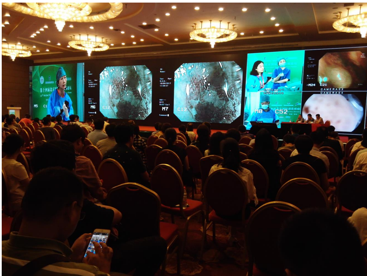
图 9 操作专家内镜诊治的演示.