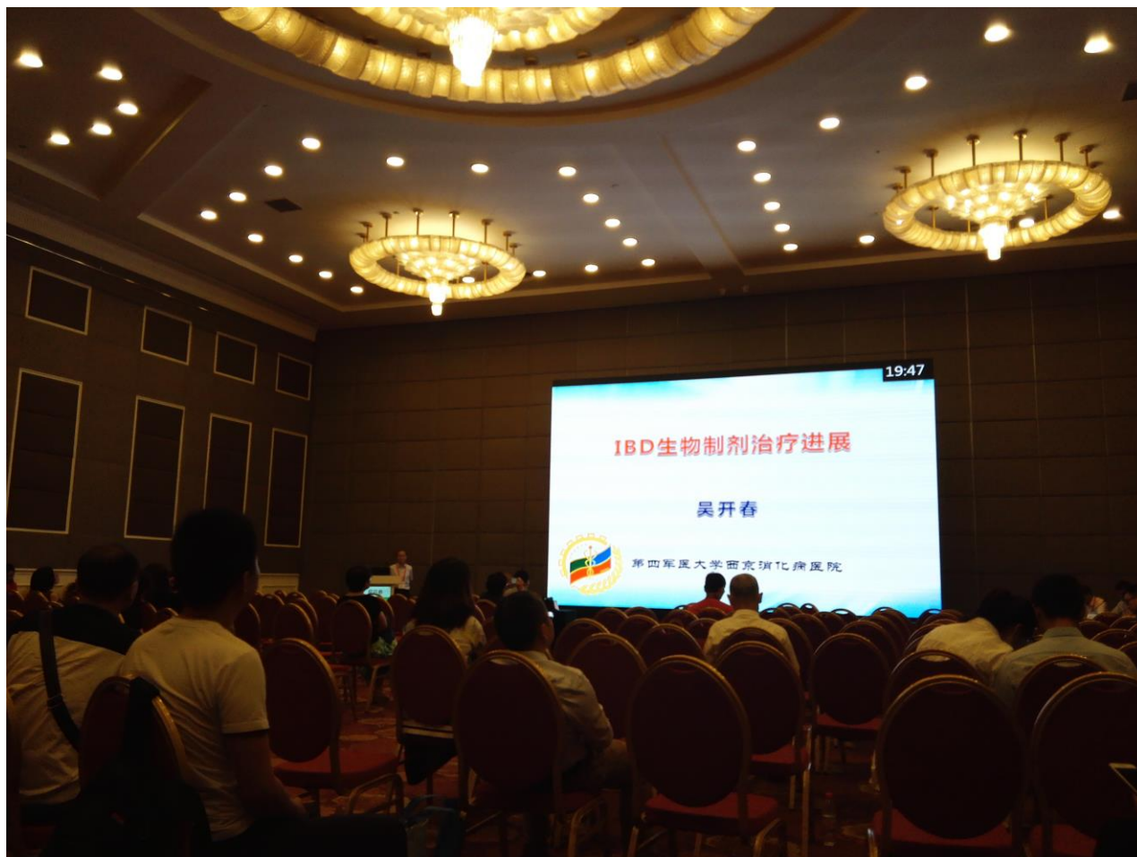
图 11 IBD 生物制剂治疗进展(吴开春).