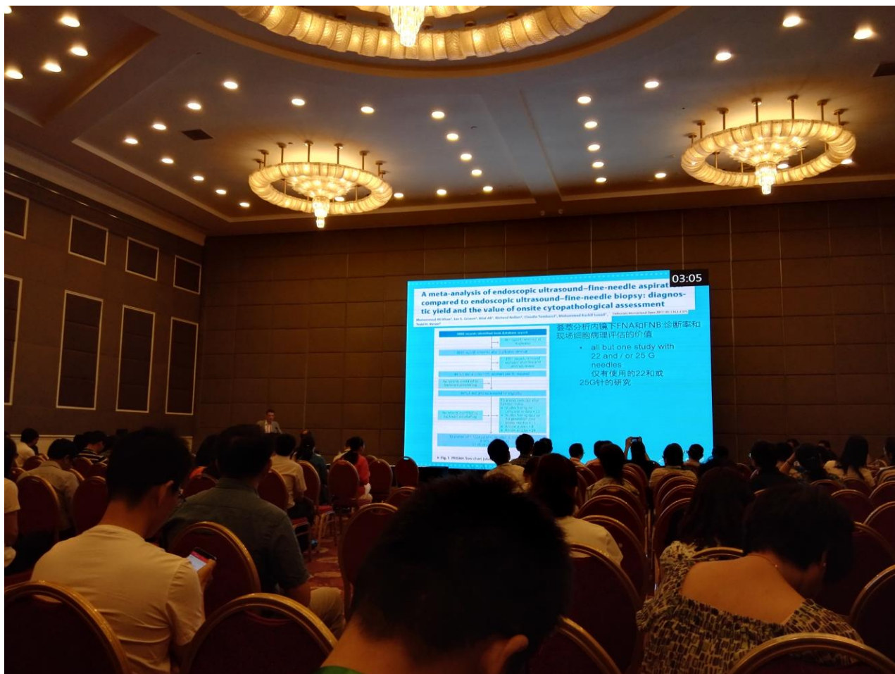
图 5 荷兰阿姆斯特 Erasmus 医学中心内镜中心 Jan-Werner Poley 教授演讲.