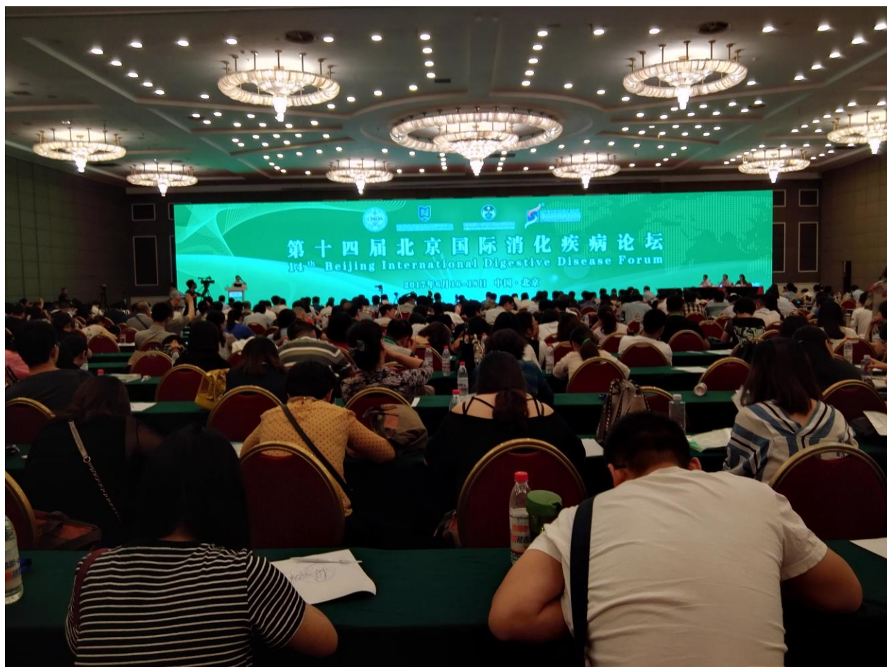
图1 第十四届北京国际消化疾病论坛现场，会议大厅座无虚席。