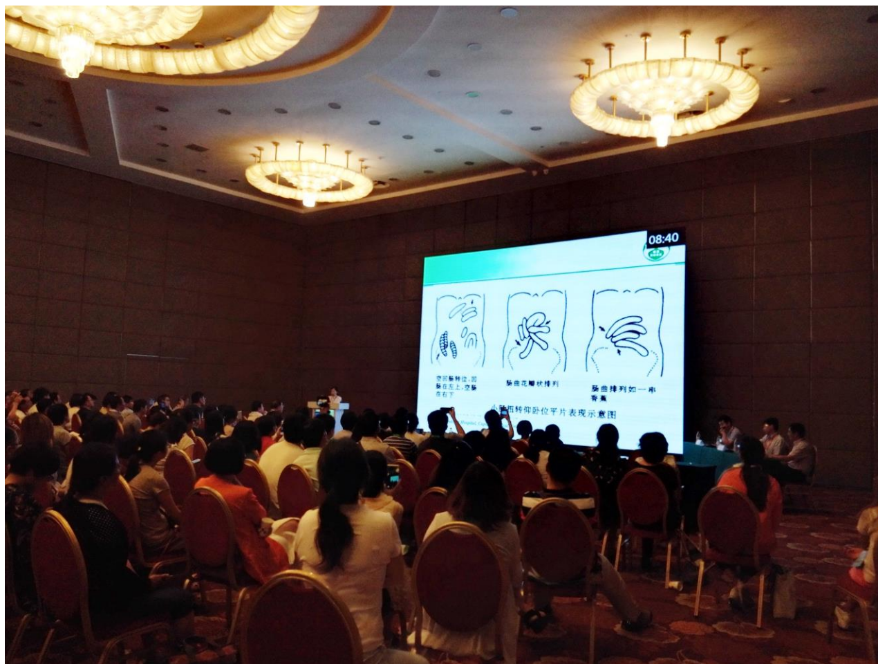
图 10 胃肠道急诊的影像学评价(赵丽琴).