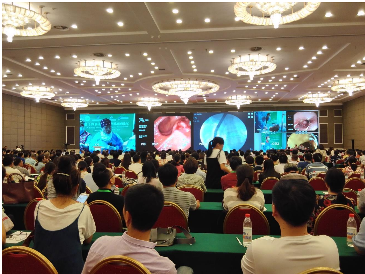
图 3 操作专家内镜诊治的演示.

观看内镜演示后, 走进胃肠肝胆外科联合论坛大厅, 聆听了德国海德堡大学路德维希堡医院消化科内镜主任 Arthur Robert Schmid 演讲的“An advanced over-the-scope therapy -for perforation closure, hemostasis and full-thickness resection”(图 4)和荷兰阿姆斯特 Erasmus 医学中心内镜中心 Jan-Werner Poley 教授演讲的“The role of FNB in EUS guided tissue acquisition”(图 5).