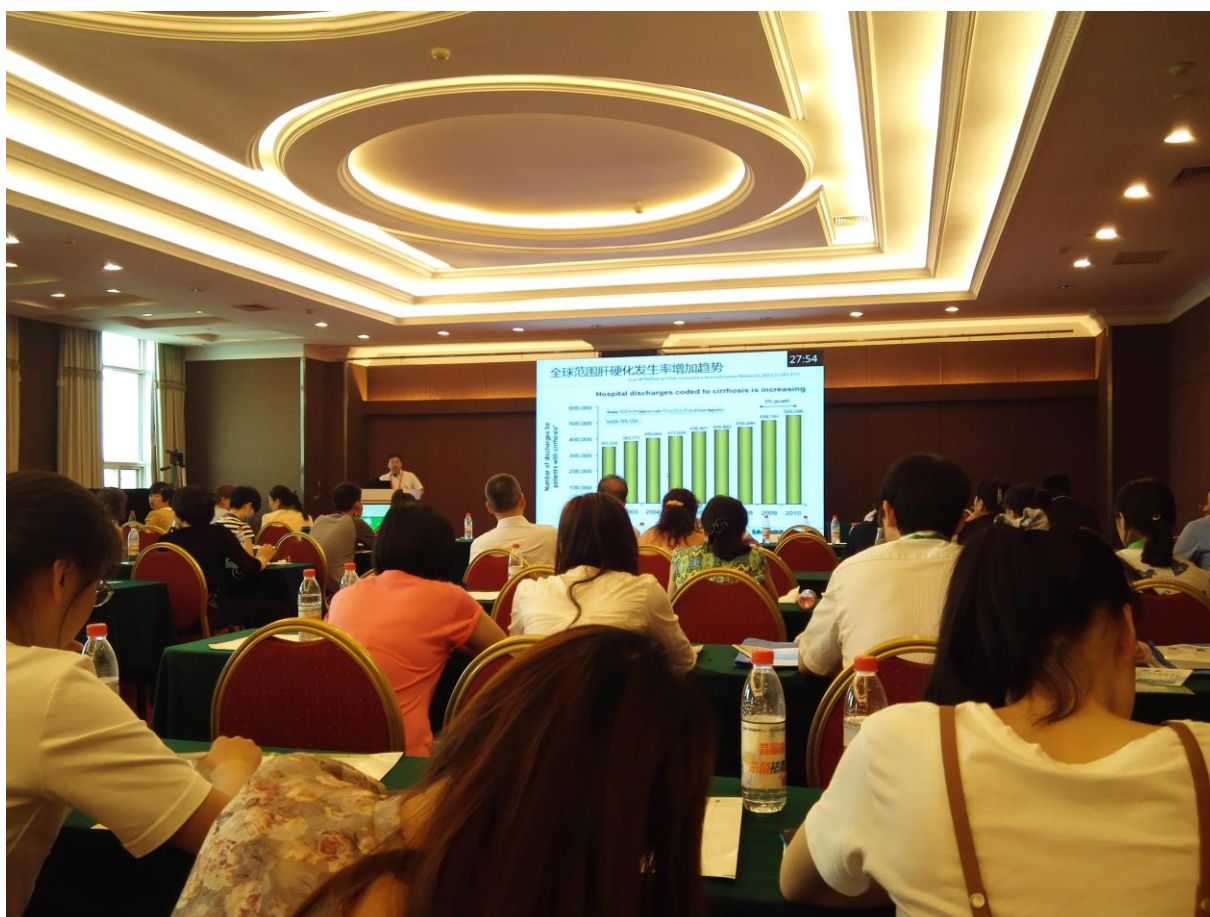
图 6 麻醉分会场.